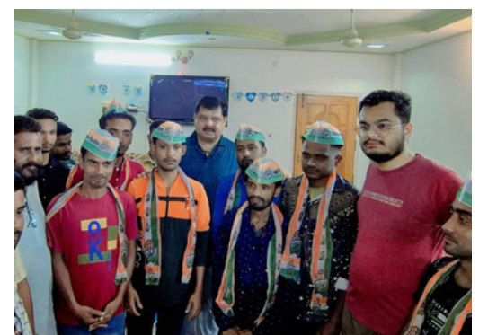
চামগুৰিত শুকুৰবাৰে বহুকেইজনে যোগদান কৰে কংগ্ৰেছত