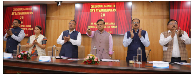
আত্মনির্ভৰ অসম অভিযান ২.০ৰ আৰম্ভণি অনুষ্ঠানত অন্যান্যসকলৰ সৈতে মুখ্যমন্ত্ৰী

ই-সংবাদ, ১৮ অক্টোবৰঃ অসমৰ মুখ্যমন্ত্ৰী ড০ হিমন্ত বিশ্ব শৰ্মাই অসমলৈ পিঠি দি বিজেপিৰ ৰাষ্ট্ৰীয় সমিতিয়ে দিয়া দায়িত্ব পালনৰ্থে ঝাৰখণ্ডত ব্যস্ত থকাৰ অভিযোগৰ মাজতে ৰাজ্যত বৃহৎ বিদ্ৰোহ আৰম্ভ হৈছে। হঠাতে এই বিদ্ৰোহে ভয়ানক ৰূপ লৈছে। ডিজিটেল ইণ্ডিয়াৰ কথা কে অহা চৰকাৰৰ শেষাংশ ৬ পৃষ্ঠাত